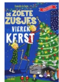
De Zoete Zusjes vierden Kerst