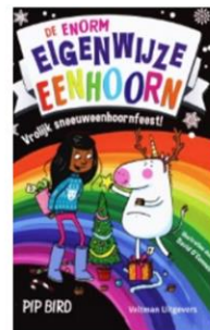
De enorme eigenwijze eenhoorn