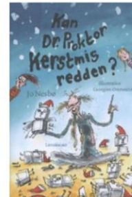
Kan Dr. Proktor Kerstmis redden?