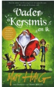
Vader Kerstmis en ik